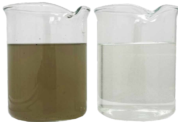
Foto 1. Hallvesi enne ja pärast puhastusprotsessi

Miridon pakub parimat võimalikku tehnoloogiat hallvee puhastamiseks nii kodumajapidamistes kui ka ärihoonetes. Seadmetes kasutatav tehnoloogia põhineb tavapärasel aktiivmudapuhastusel, kuid erinevalt tavapärasest aktiivmudapuhastist toimub biomassi eraldamine veest membraanidega filtreerimise teel. Täpsemalt imetakse vaakumpumba abil puhas vesi läbi membraanide, jättes aktiivmuda õhutuskambrisse. Tulemuseks on selge ja lõhnatu vesi (Foto 1), mis vastab standardile EVS-EN 16941-2:2021: „Puhastatud hallvee kasutussüsteemid“.